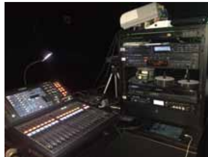
Main Console(QL-1) + Players