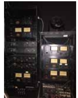
PowerAmpRack + Rio1608